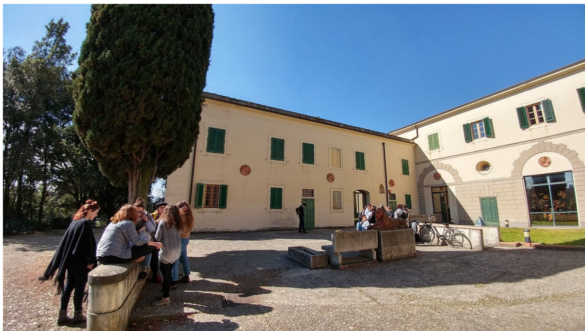
La sede ISIA Firenze si trova temporaneamente presso le Scuderie di Villa Strozzi, uno dei più importanti parchi storici di Firenze. Una sede di prestigio storico fatta realizzare verso la metà del XVI secolo da Giovan Battista di Lorenzo Strozzi

La didattica a distanza ha mostrato l'importanza di lavorare ad una diversificazione dei canali di erogazione, questa Direzione non ritiene che la didattica a distanza sia (e sia stata) un male assoluto, è anzi una realtà fruibile da gestire e affiancare alla didattica tradizionale. Per questo occorre tuttavia un lavoro quotidiano di installazione, messa a punto e verifica delle piattaforme hardware e software digitali. Anche conferendo incarichi specifici.