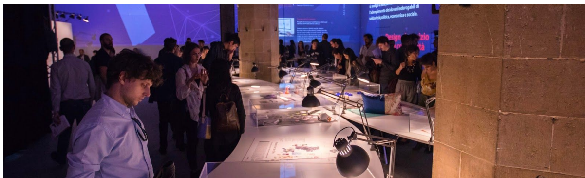
PNA 2018 evento realizzato da ISIA Firenze

Per tali attività si indica di prevedere in bilancio al CAP 258 la somma di 15.000 €