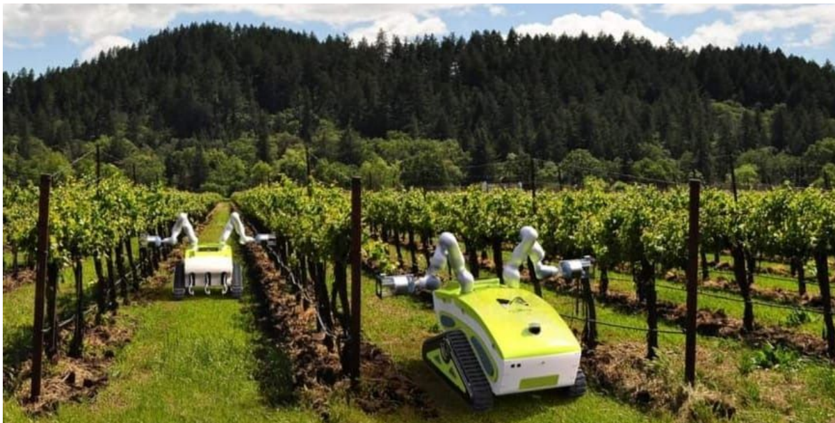
XXVI Compasso d'Oro 2020 uno degli Attestati Targa di Merito è stato assegnato al progetto AGRI/CULTURE, Tesi Specialistica di ricerca sul prodotto, Firenze 2017

divulgazione dei risultati) pari a: 10.000 € per la produzione di materiali divulgativi da assegnarsi sul (CAP 254) specifico per Manifestazioni artistiche .